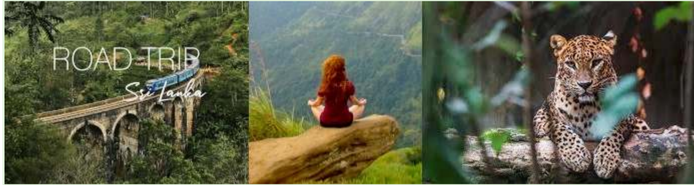
斯里兰卡假期 - 带导游的自然之旅和探险

时间： 该实验是在 COVID-19 疫情期间启动的，当时斯里兰卡依赖旅游业的经济已经受到严重影响。